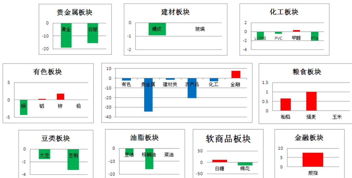
板块资金流向(单位:亿元)