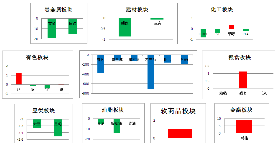
板块资金流向(单位:亿元)