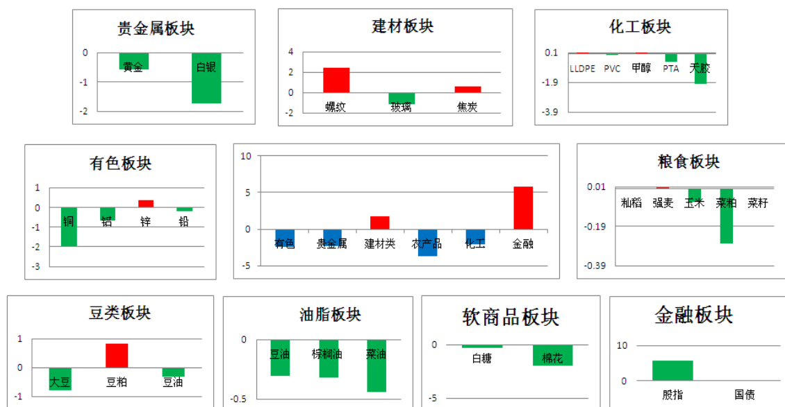
板块资金流向(单位:亿元)