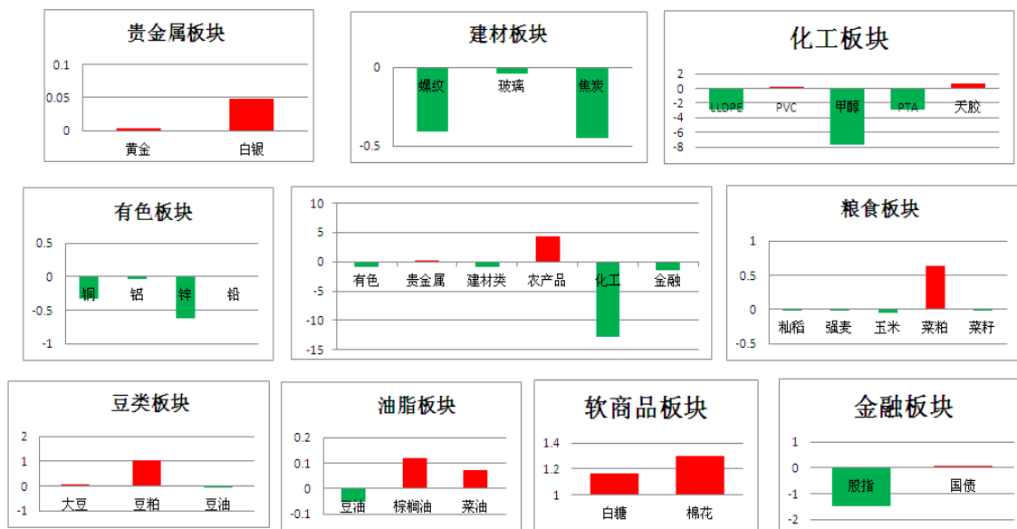
板块资金流向(单位:亿元)