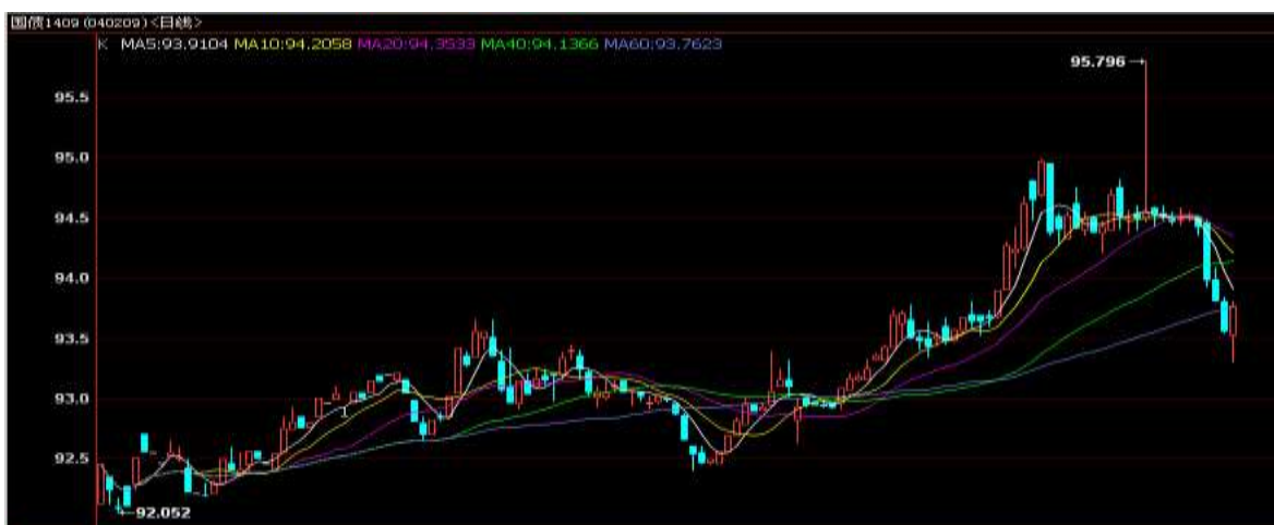
图1 TF1409 合约日K线走势

本周国债期货成交量增加，价格大幅下跌，TF1409 合约周一开盘 94.506，周五收盘 93.766，全周成交量 11939 手，持仓量 7447 手，涨跌幅-0.78%。