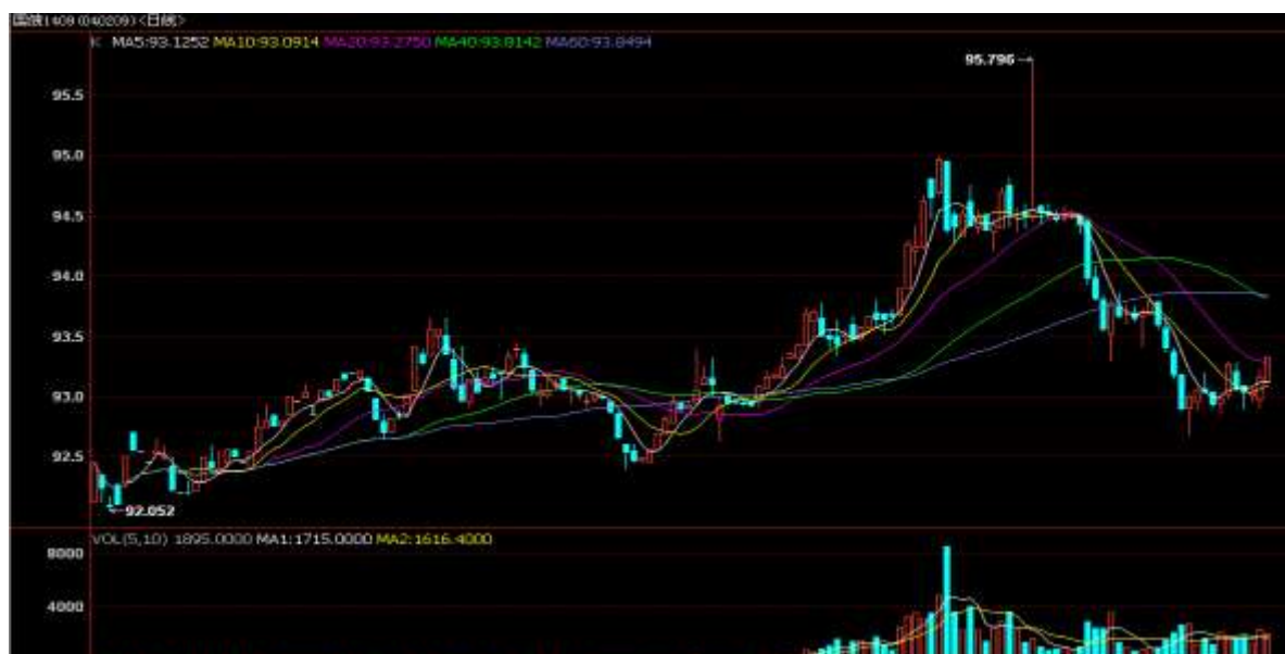
图 1 TF1409 合约日 K 线走势

本周国债期货价格下探 93 元位置后开始反弹，成交量小幅上升，TF1409 合约周一开盘 93.208，周五收盘 93.312，全周成交量 8631 手，持仓量 6830 手，涨跌幅 0.05%。