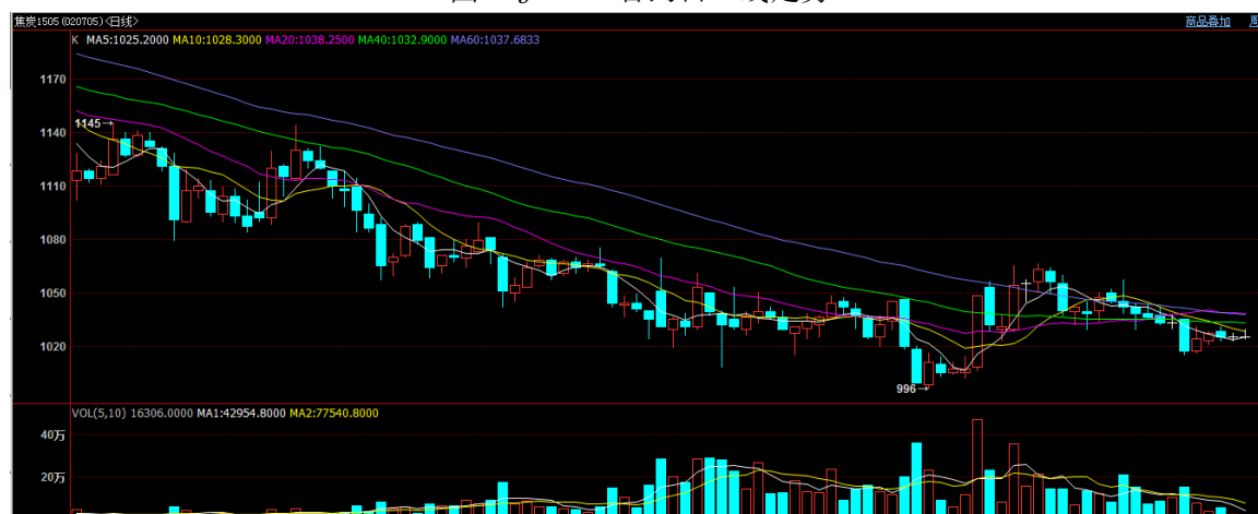
图2 J1505 合约日 K 线走势