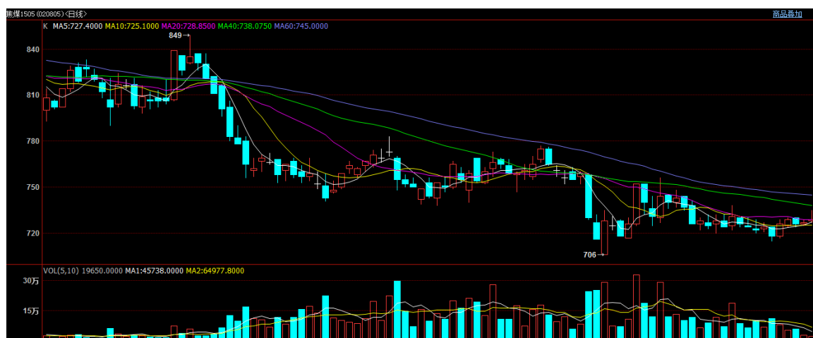
图1 Jm1505 合约日 K 线走势

本周焦煤焦炭期货价格周一大幅下挫，之后企稳，主力合约 Jm1505 周一开盘 724，周五收盘 727，全周成交量 318202 手，持仓量 132590 手，与前一周收盘价比涨跌幅 0.41%。焦炭期货保持弱势，主力合约 J1505 周一开盘 1035，周五收盘 1025，全周成交量 350762 手，持仓量 100888 手，与前一周收盘价比涨跌幅-0.77%。