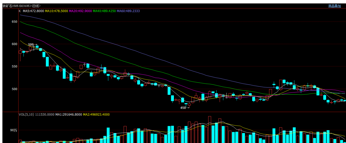
图 3 i1505 合约日 K 线走势

本周铁矿石期货维持弱势，主力合约 i1505 周一开盘 475，周五收盘 474，全周成交量 2230772 手，持仓量 428730 手，与上一周收盘价比涨跌幅-0.42%。